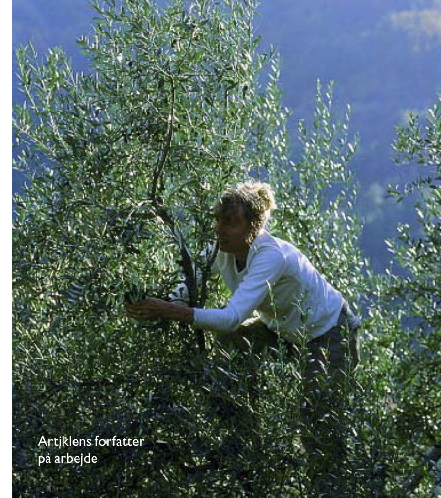
Artiklens forfatter på arbejde

Første skridt er at tage låget af flasken og lugte til olien. Hvad er det der rammer ens næsebor? Er det en duft af natur, af græs, af grønne blade, af moden hø,