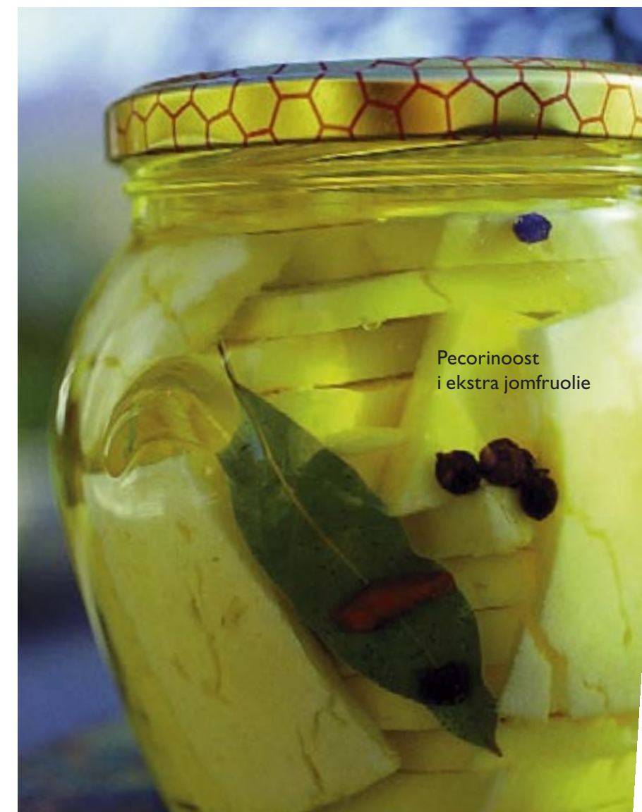
Pecorinoost i ekstra jomfruolie

For at kontrollere kvaliteten foretages i dag både en kemisk og en sansemæssig analyse. Den kemiske analyse omfatter 23 forskellige målinger som derefter suppleres af en paneltest som vurderer de sansemæssige egenskaber. En ekstrajomfruolie må ikke have nogen smagsdefekter, mens det er tilladt en jomfruolie at have svage defekter.