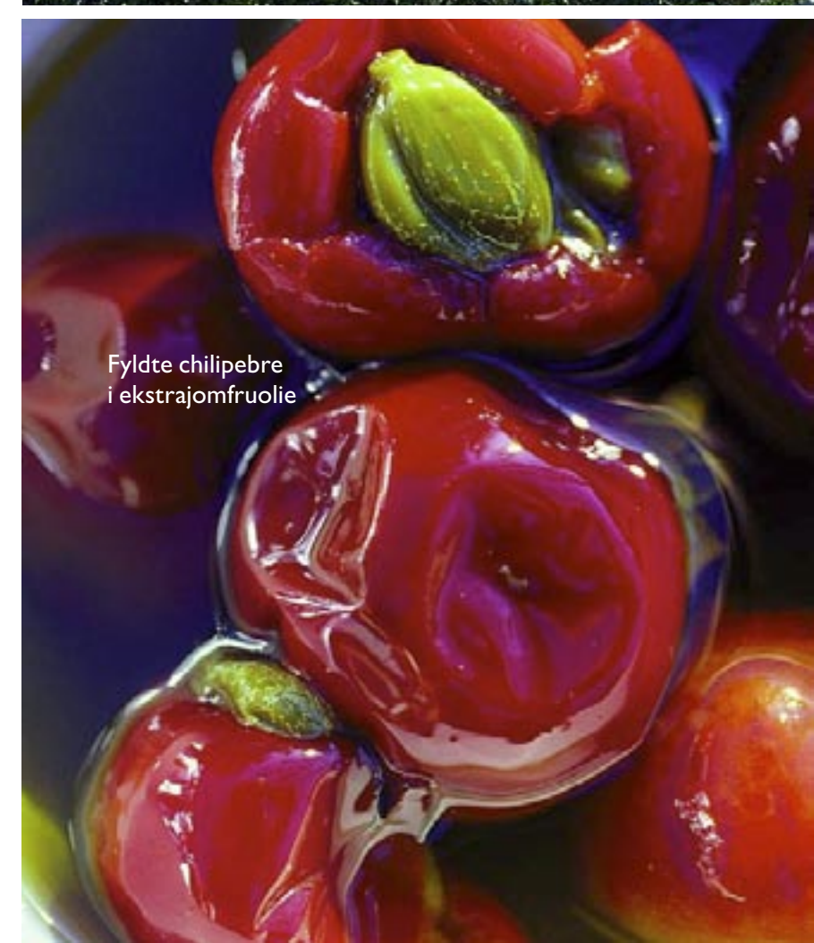
Fyldte chilipebre i ekstrajomfruolie